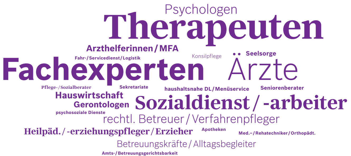
Abbildung 2: Häufigste Kooperationspartner der Pflege nach Anzahl der Nennungen in den vier Arbeitsgruppen

Die professionelle Pflege sieht sich mehrheitlich in einer Advocacy-Funktion für die Menschen mit Pflegebedarf. Sie erwartet von allen Kooperationspartnern Verlässlichkeit, Konsensbereitschaft, Termintreue und die Zusammenarbeit auf Augenhöhe, um die gemeinsamen Versorgungsziele des Menschen mit Pflegebedarf zu erreichen. Die sektorale Trennung bzw. die in den Übergängen zwischen den unterschiedlichen Sozialgesetzbüchern angelegten Schnittstellen werden als problematisch wahrgenommen. Sie sind ein Hemmnis für eine am Menschen orientierte Versorgung.